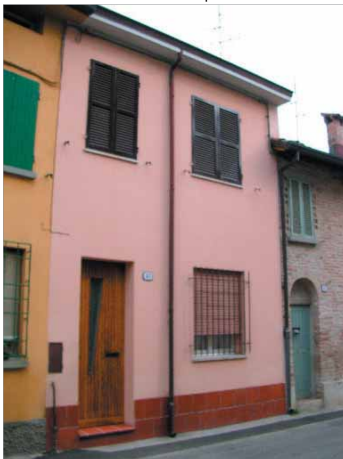
Via Berti 41 Fronte Principale